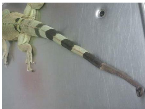
Fig. 1. Coadă regenerată post-operator la iguană (caz 4) după 6 luni de la intervenția chirurgicală (fotografie originală)